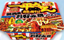
一平ちゃん夜店の焼そば 関西風お好み焼ソース味