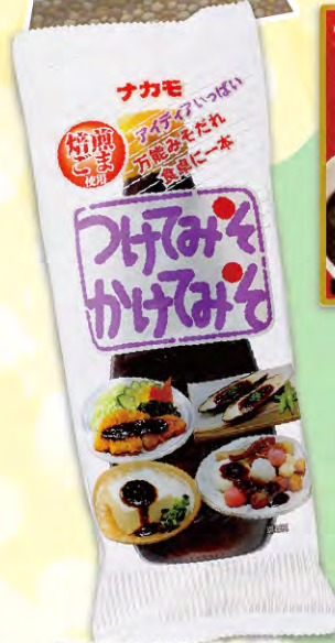
つけてみそ かけてみそ 400g