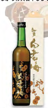
純米吟醸仕込みの梅酒 白老梅