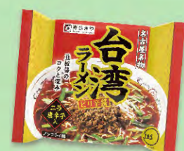
即席台湾ラーメン ピリ辛醬