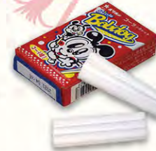
コーラシガレット