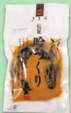
伝匠 吟づくり瓜奈良漬