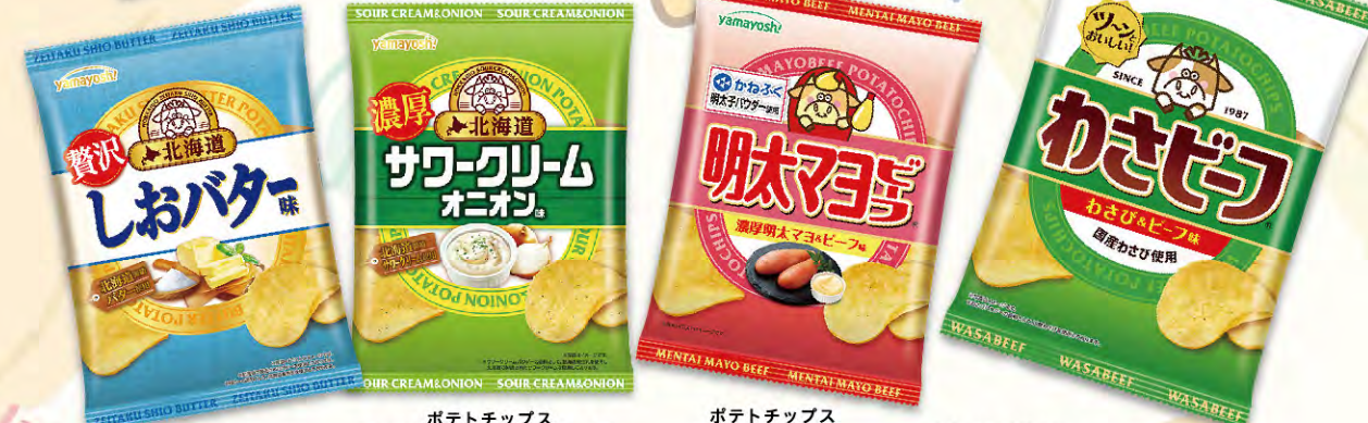
ポテチチップス 北海道しおバター

毎回好評いただいている駄菓子とみんな大好きポテチ どちらもお菓子パーティで盛り上がるラインナップです