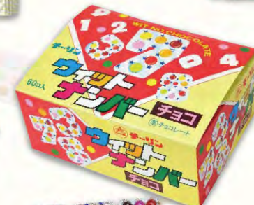
ウィットナンバー チョコ