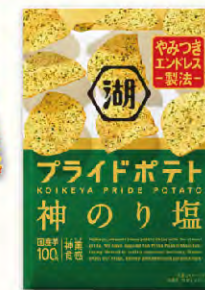
プライドポテト 神のり塩