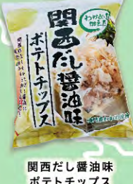
関西だし醤油味 ポテトチップス