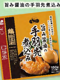
旨み醤油の手羽先煮込み