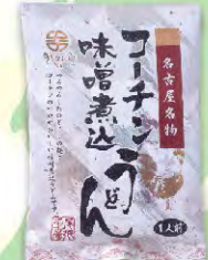
名古屋名物 コーチン味噌煮込うどん