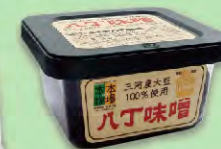
三河産大豆の 八丁味噌 300g