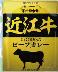
近江牛ビーフカレー