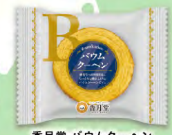
香月堂 パウムクーヘン