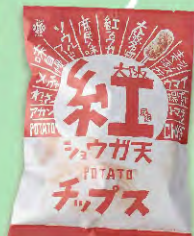
大阪紅ショウガ天 ポテトチップス