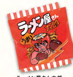
ラーメン屋さん 太郎