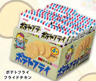
ポテトフライ フライチキン