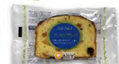
香月堂 フルーツパウンド