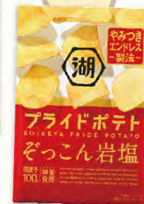
プライドポテト そっこん岩塩