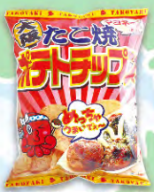
たこ焼ポテトチップス