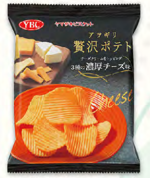
アツギリ贅沢ポテト 3種のチーズ