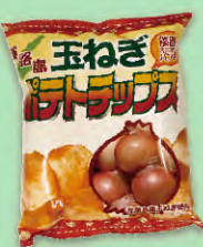
玉ねぎポテトチップス