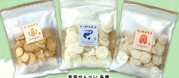
島風せんべい 各種