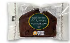
香月堂 ビターチョコパウンド