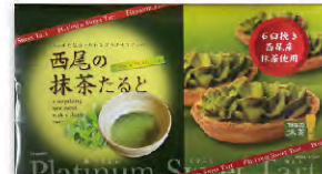
西尾の抹茶たると