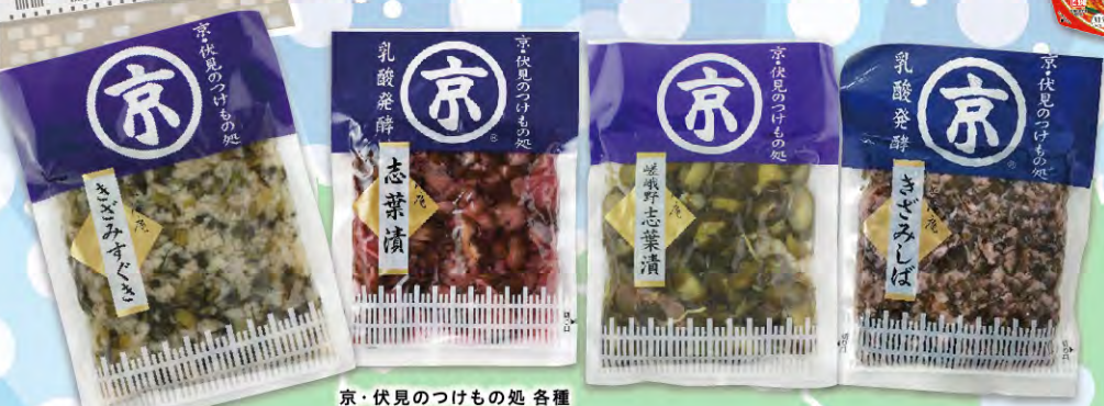
京・伏見のつけもの処 各種