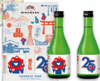
菊正宗 大阪・関西万博記念ラベル