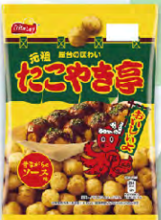
元祖たこやき亭 昔ながらのソース味