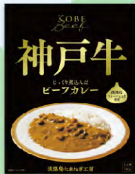
神戸牛ビーフカレー