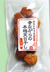
昔ながらの天日干ししそ漬