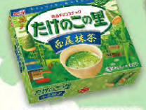
たけのこの里西尾抹茶