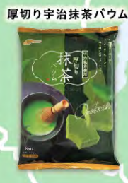
厚切り宇治抹茶パウム