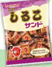
スターしるこサンド