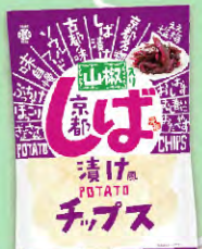
京都しば漬け風山椒入り ポテトチップス